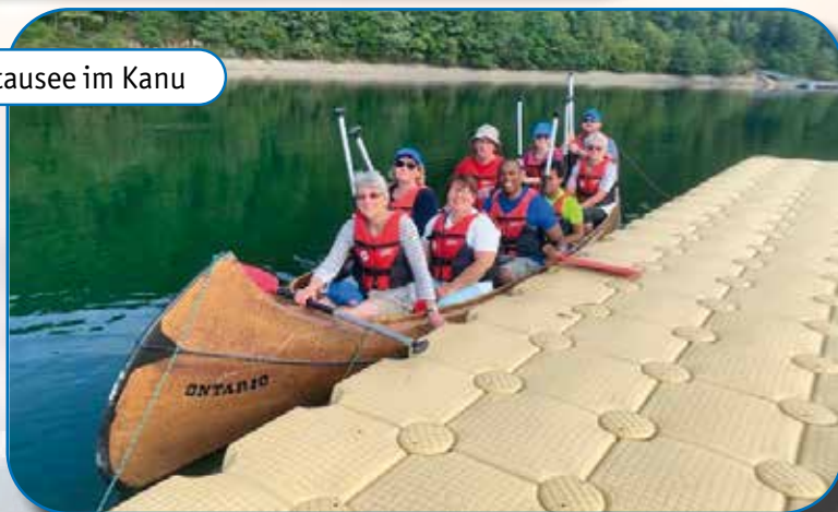
Stausee im Kanu