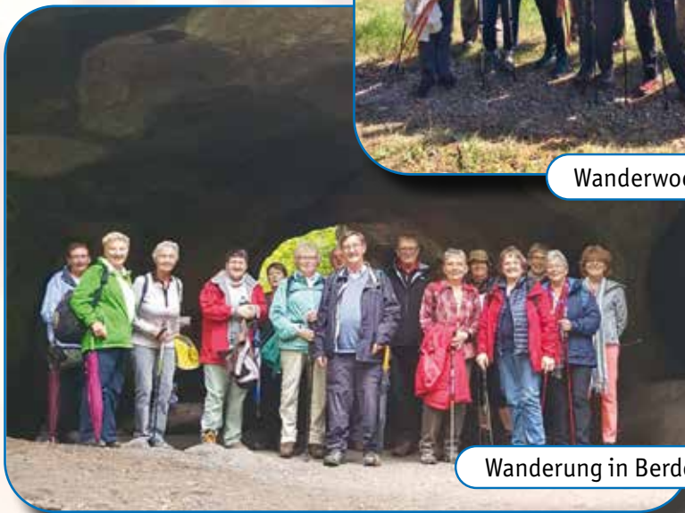
Wanderung in Berdorf