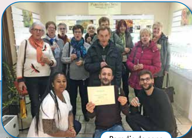
Paradis de sens