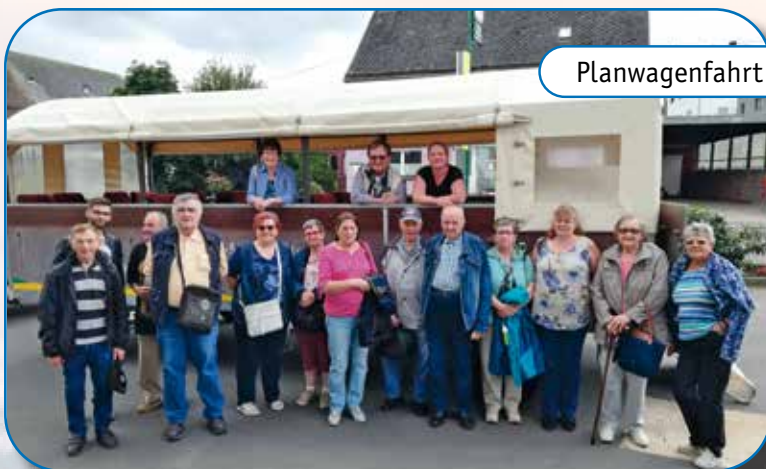
Planwagenfahrt in der Eifel